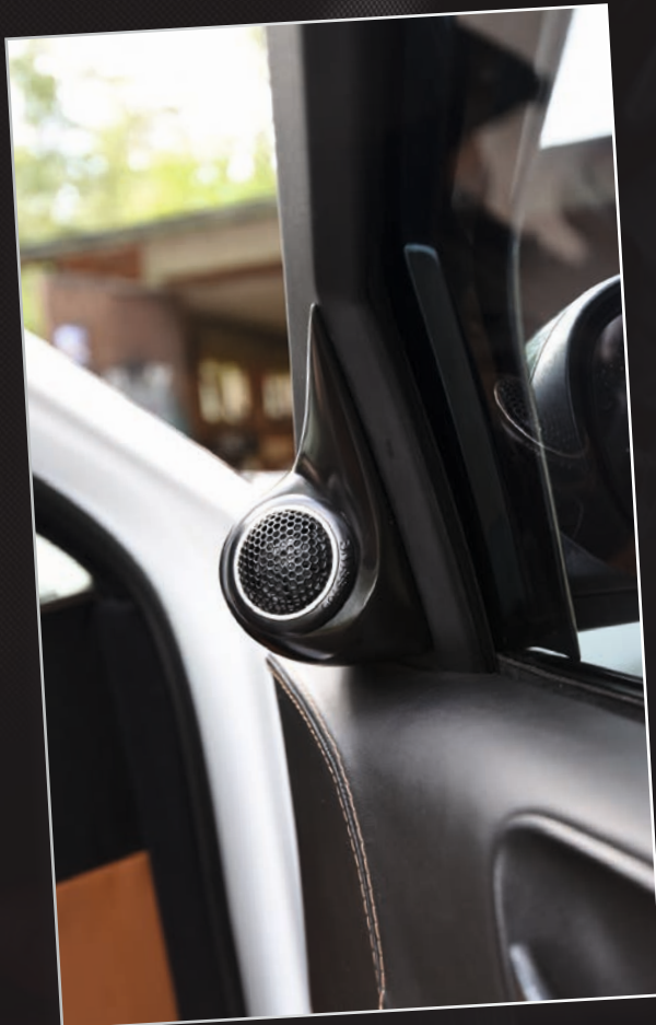
Diskantit on asennettu perustyylikkäästi peilikolmioihin.