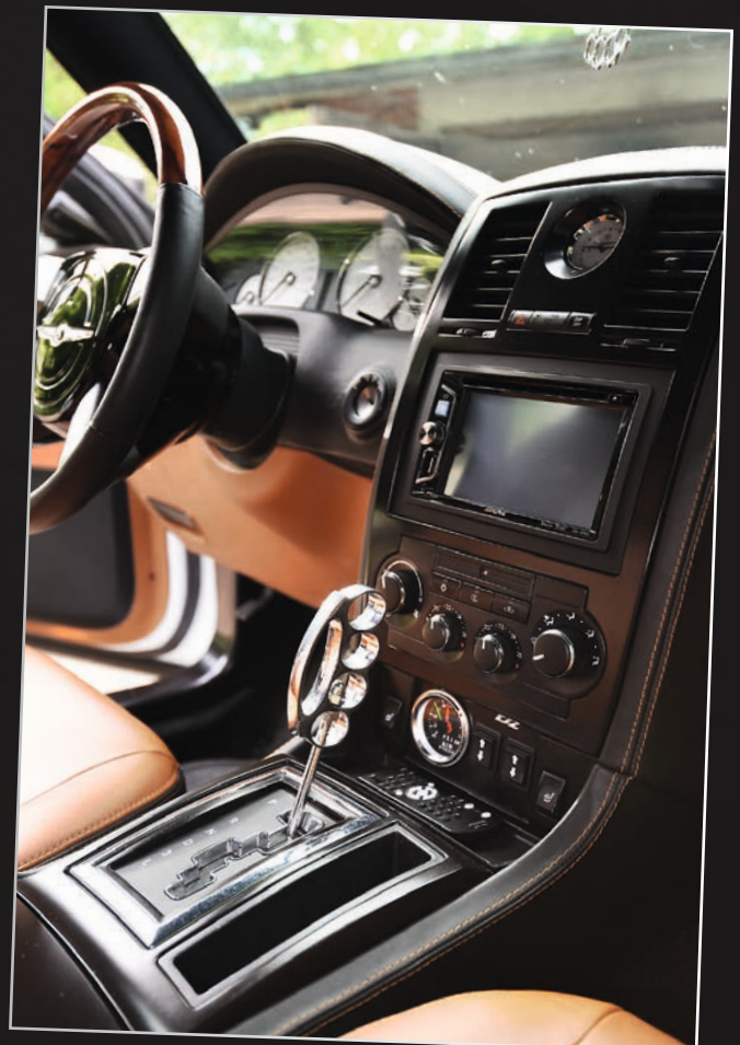
Montako nyrkkirautaa löydät tästä autosta?