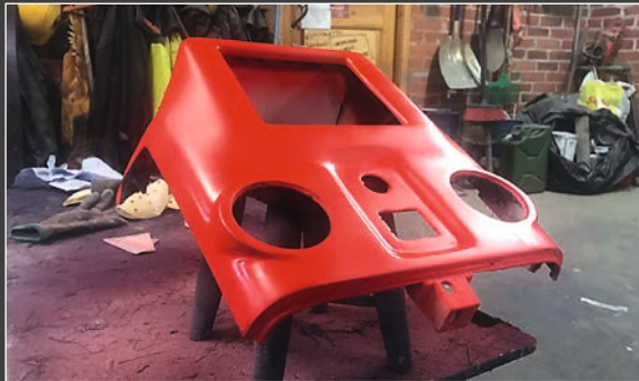
▲ Modifioitu keskikonsoli valmiiksi maalattuna.