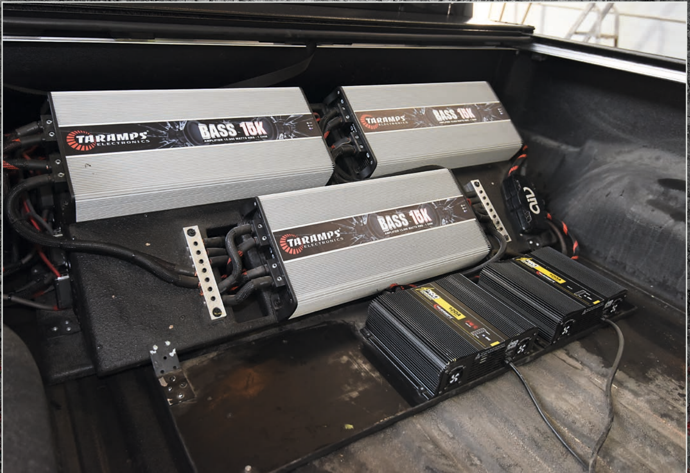
Valtalta löytyy subbaripään vahvistimet, seitsemän Optiman akkua sekä kaksi laturia.