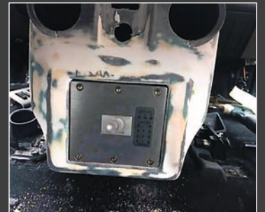
▲ Massive Audion DSP sovitettiin keskikonsolin takaosaan. Kirvesmiestyylillä tietenkin!