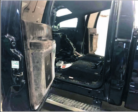
◀▶ Ovien paneelit verhoilua vaille valmiina.