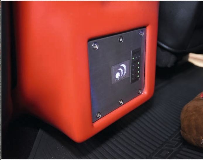
Massive Audion CORE-1 despillä tehdään kaikki setin säädöt. Laite on asennettu uudelleenmodifioidun keskikonsolin takaosaan.