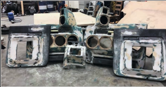
▼▲ Lisää osia verhoilijalle.