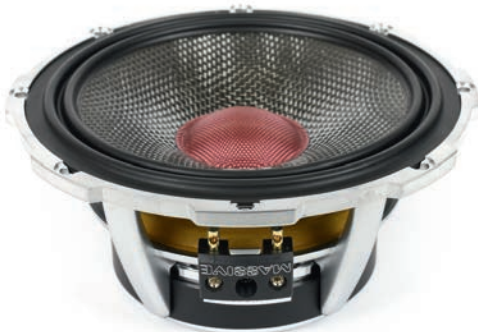
▲ Midbasson ripustukset sallivat kartiolle todella laajan liikeraidan. Elementit ovat myös kokoluokassaan poikkeuksellisen herkkät.

tuva 12 dB suodin, jossa on myös pari vastusta diskantin tasonsäätöä varten. Suotimissa käytetyt komponentit ovat keskimääräisiin 2-tiesarjojen suosimiin verrattuna korkeahkoa laatutasoa. Kaiutinkaapeille löytyy perustasoinen haarukkaliitinterminaali. Ei mitään valittamista tällä sektorilla, ajavat takuulla asiansa. Moni harrastaja kytkenee tämän setin aktiivisesti, jolloin passiivijakarit jäävät tyhjänpantiksi. Tästä syystä jakosuotimien osiin tuskin on järkevää edes panostaa tätä suuremmin, ellei sitten myyntiin tule myös erillinen "aktiivisarja" jossa on pelkät kaiutinelementit.