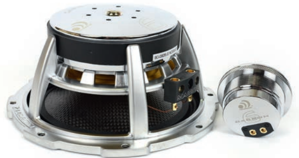
▲ Sekä diskantissa että midbassossa on käytetty kaiutinkaapelien terminaaleina ruuvikiisteisiä malleja.

Sarjan midbassoissa on jo mainittu hiilikuituinen kartio. Yläripustus on valmistettu butyylikumista ja se on poimutettua mallia. Nomexityyppisellä alaripustuksella on leveyttä keskimääräistä enemmän ja se tuntuu sormin painelemalla todella pehmeältä ja joustavalta. Elementtien rungot ovat alumiinia ja magneetilla on kokoa hieman keskimääräistä 6,5" elementtiä enemmän. Kaiutinkaapeille löytyy diskanttien tapaan kuusiokoloruuvikiisteiset terminaalit, joiden fyysinen koko on sentään onneksi joka suhteessa järkevämpi. Elementtien viimeistely on tässäkin tapauksessa huippuluokkaa. Aivan