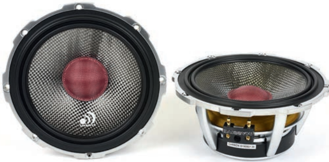
▲ Alumiininen runko on sopivan avonainen, eikä ahdistaa elementin hengittämistä taaksepäin. Midbassojen rakenne on teknisesti fiksu ja viimeistelykin kipuaa vahvasti kiitettävälle osastolle.