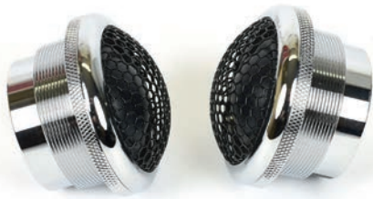
▲ Diskanttielementtien kuori on kokonaan kiillotettu metallia ja viimeistely käytännössä virheetöntä luokkaa.