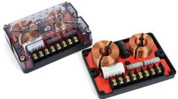
▲ Carbon 6:n jakosuotimet on kasattu komponenttien koko ja laatu huomioiden yllättävänkin kompakteihin koteloihin.