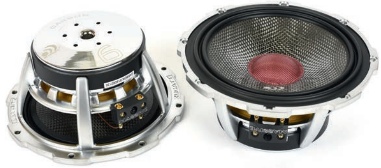
▲ Carbon 6:n midbassoissa on hiilikuituiset kartiot ja poimutettu butyylikuminen yläripustus.